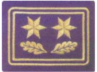
Abb. 28 Direktor der Feuerwehr