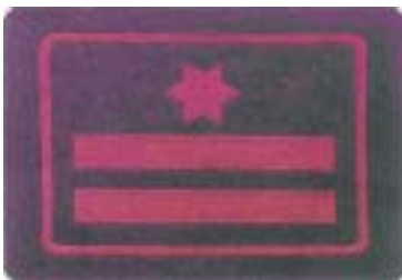
Abb. 17 Hauptbrandmeister mit Zulage