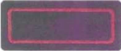
Abb. 14 Brandmeister