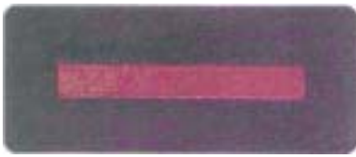
Abb. 13 Brandmeister – Anwärter