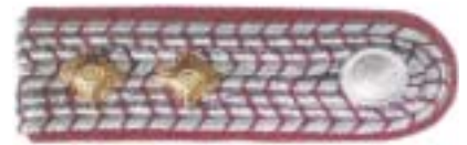
Abb. 8 Oberbrandmeister