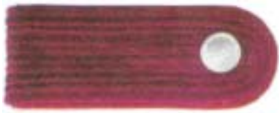
Abb. 1 Feuerwehrmann-Anwärter