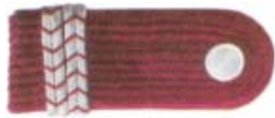
Abb. 2 Feuerwehrmann