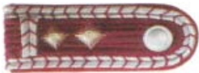
Abb. 5 Löschmeister