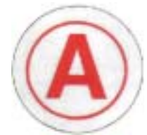
Abb. 20 Atemschutzträger