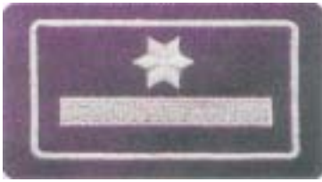
Abb. 23 Brandamtmann/Brandamtfrau