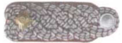
Abb. 10 Brandinspektor