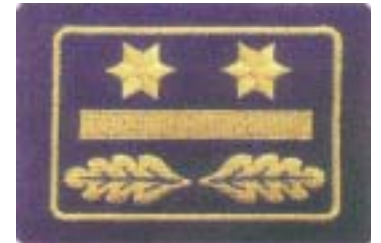
Abb. 20 Brandoberrat