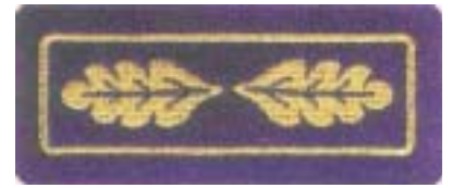
Abb. 18 Brandreferendar