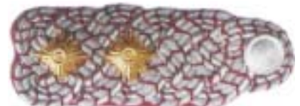
Abb. 11 Oberbrandinspektor