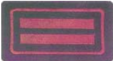
Abb. 16 Hauptbrandmeister