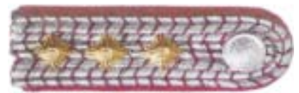
Abb. 9 Hauptbrandmeister