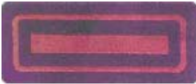
Abb. 15 Oberbrandmeister