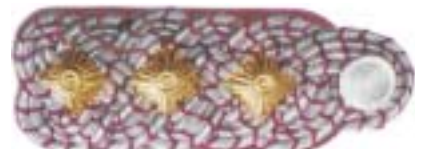
Abb. 12 Hauptbrandinspektor