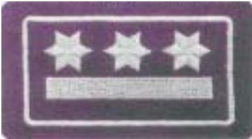
Abb. 25 Brandoberamtsrat