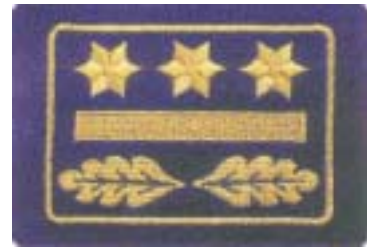
Abb. 26 Branddirektor