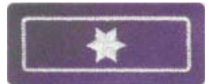
Abb. 21 Brandoberinspektor – Anwärter