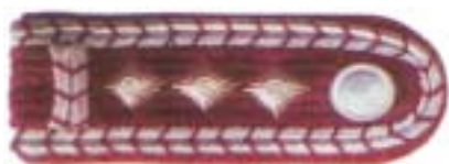
Abb. 6 Hauptlöschmeister