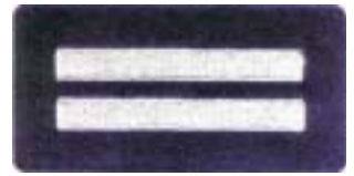
Abb. 12 Zugführer