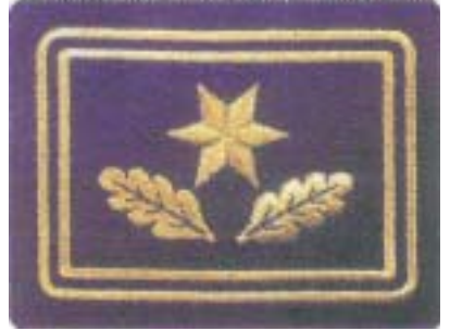
Abb. 27 Leitender Branddirektor