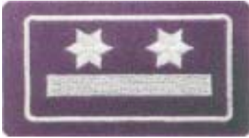
Abb. 24 Brandamtsrat