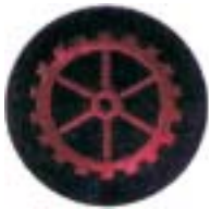
Abb. 19 Gerätewart