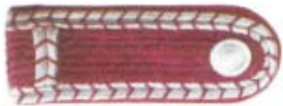
Abb. 3 Oberfeuerwehrmann