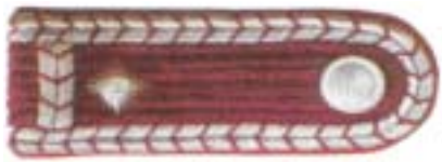
Abb. 4 Hauptfeuerwehrmann