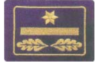
Abb. 19 Brandrat