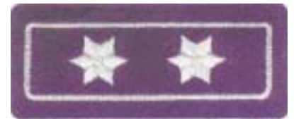
Abb. 22 Brandoberinspektor